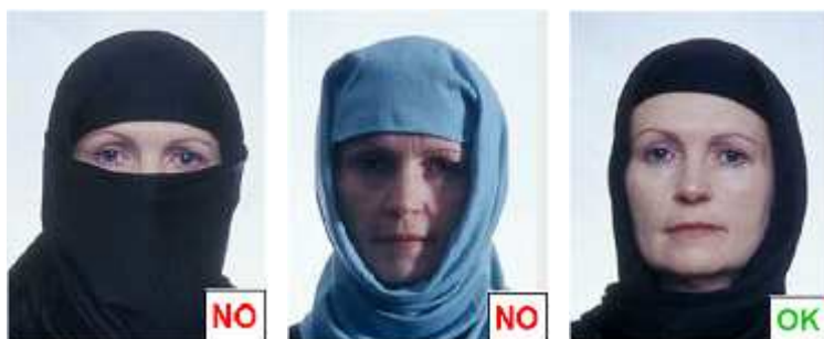
figura 12 bis